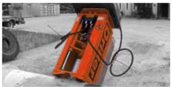
Herstellung eines Rohranschlusses

Kernbohr-Technik für Tief-, Straßen- und Kanalbauarbeiten: Das DRILLER-Bohrgerät für Bagger und Radlader bringt eine bis zu dreimal höhere Leistung als manuell ausgeführte Bohrungen. Die ausgereifte Technologie erlaubt sicheres, abgasfreies und präzises Bohren auf allen Ebenen und ist einfach zu handhaben.