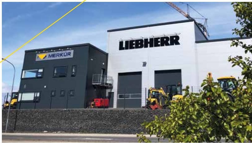
Isländischer Standort / Icelandic location: Hýsi-Merkúr in Reykjavík

Since 1997 RÜKO GmbH Baumaschinen has stood for competent and cooperative partnership with the construction industry in Germany and abroad. The core of our business activity is used construction machine trade and rental of asphalt equipment as well as special machines with operators.